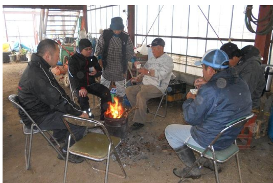
10時の休憩。社長のお手製いちぢくヨーグルトをいただきました♪

この日はスタッフ1名とメンバー2名が「うるい」の収穫及び袋詰め作業を行っていました。一本一本地面からつくしのように生えている「うるい」を根元から切り取っていきます。そうやって集めたうるいを選別し、重さを量って食べ方を紹介した紙と一緒に丁寧に袋詰めしていきます。