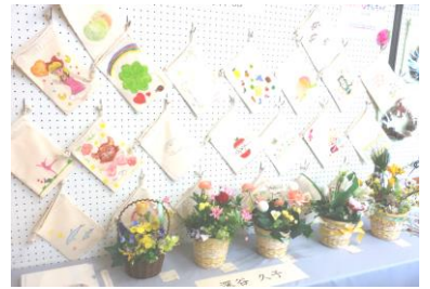
カラーセラピー教室で作った巾着袋は、色とりどりできれいでした。