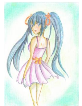
絵画教室で描いた作品

これからもあせらずゆっくりと再就職に向けて対策を見つけていながら努めていきたいです。(Iku@)