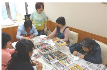
みんなの笑顔が輝いていたよ