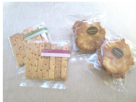
左：スティック形状でサクッとした酒かすクッキー 右：こころんの羽は、アーモンドの香ばしさが人気

最後になりますが、こころん工房で色々なお菓子作りを経験し、目標としている一般就労に向けて努力していきたいと思っております。今後ともこころん工房をよろしく願いたします。(O.H)