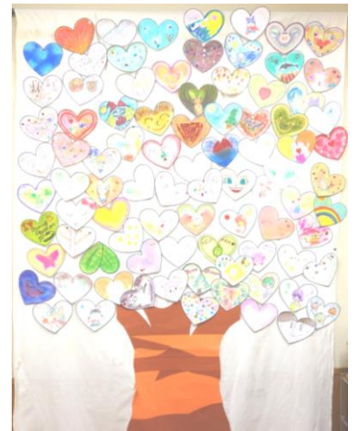
カラーセラピー体験で、ハートの実がたくさんありました。

実行委員の準備段階から当日の運営まで、メンバーさんがそれぞれの立場、役割を責任を持ってこなしてくれ、一段と輝く表情を見ることができました。いろいろな体験をしながら、自信を持って日々を過ごし、更に輝いてくれることを願っています。(渡辺厚子)