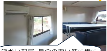
暖かい部屋。具合の悪い時に横になれる大きなソファ。幸せ！